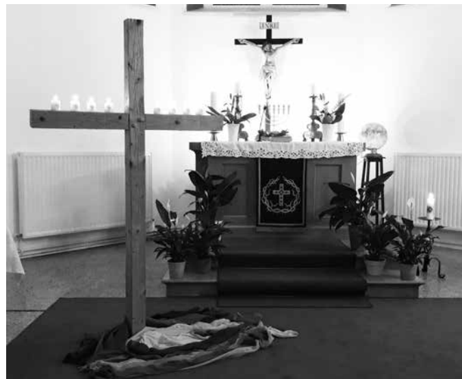
Die Kirche zum Weltgebetstag in Zwota am 4. März 2022