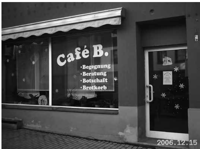
Das Café B im Jahr 2006 in der Markneukirchner Straße 84.