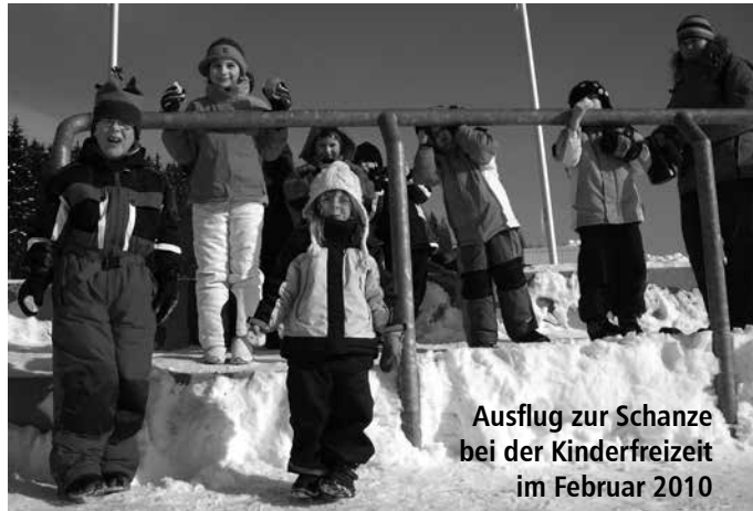
Ausflug zur Schanze bei der Kinderfreizeit im Februar 2010