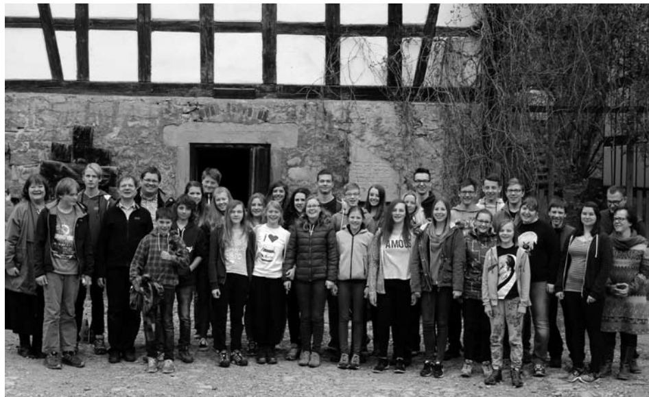
Gruppenfoto mit allen Teilnehmern im Hof der Familienkommunität "Siloah"