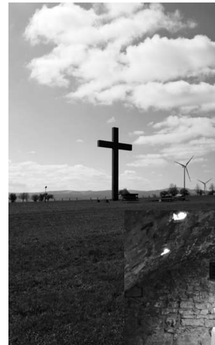
Abschlussgottesdienst in der Krypta